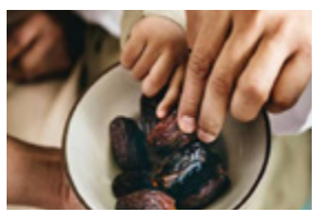
परंपरा पैगंबर मुहम्मद के समय से चली आ रही है।

30 दिन तक चलने वाले रमजान के महीने को खुदा की इबादत का महीना कहा जाता है। रमजान के दौरान मुसलमान सूर्योदय से सूर्यास्त तक उपवास रखते हैं, जिसे रोज़ा कहते हैं। चांद का दीदार होने के बाद से ही लोग पहला रोज़ा रखेंगे। रोज़ा रखने पर सूर्योदय से पहले सहरी और सूर्यास्त के समय इफ्तार किया जाता है। इफ्तार के दौरान रोज़ेदार सबसे पहले खजूर खाते हैं। क्या आप जानते हैं कि आखिर क्यों रोज़ा खोलने के लिए सबसे पहले खाया जाता है खजूर? खजूर से रोज़ा खोलने की