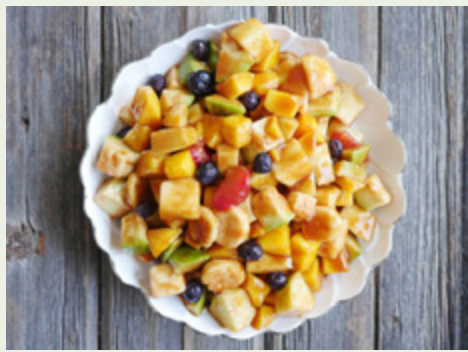
कि स्ट्रबेरी, आड़ू, या पाइनएप्पल। तो आइए, जानते हैं इसे बनाने की आसान रेसिपी: सामग्री: 1 सेब (कटा हुआ) 1 केला

फ्रूट चाट एक हेल्दी और ताजगी से भरी रेसिपी है, जो सहरी और इफ्तारी के लिए एक बेहतरीन विकल्प है। इसमें ताजे फल होते हैं, जो शरीर को पोषण और ऊर्जा देते हैं। यह स्वादिष्ट और सेहतमंद भी है। आप इस चाट में अपनी पसंद के फल जोड़ सकते हैं जैसे