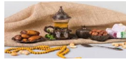
उत्पन्न कर सकता है। इसलिए, सहरी में हल्का और सादा आहार लें, जो आपका पेट आराम से हजम कर सके और प्यास कम लगे।

रमजान का महीना इस्लामिक कैलेंडर का सबसे पाक महीना है, जिसे पूरी दुनिया में बड़ी श्रद्धा और समर्पण के साथ मनाया जाता है। इस महीने में रोज़ेदार पूरे दिन बिना पानी के रोज़े रखते हैं और अधिकतर समय इबादत में बिताते हैं। 2025 में रमजान 2 मार्च से शुरू हो रहा है, और इस दौरान रोज़े रखने वाले लोग अक्सर पूरे दिन की थकान और प्यास महसूस करते हैं। हालाँकि, अगर आप इन टिप्स को ध्यान में रखते हुए अपने रोज़े का पालन करेंगे, तो आप पूरे दिन एनर्जेटिक और हेल्दी महसूस करेंगे। सुबह सहरी में नारियल पानी पिएं: रोज़े के दौरान हाइड्रेशन बहुत महत्वपूर्ण है, क्योंकि पूरे दिन पानी का सेवन नहीं किया जा सकता। इसलिए सहरी में नारियल पानी को शामिल करें। नारियल पानी शरीर को ठंडक और हाइड्रेशन प्रदान करता है, जिससे पूरे दिन प्यास कम लगेगी। साथ ही, यह शरीर को ऊर्जा देने का भी काम करता है। सहरी के दौरान नारियल पानी पीने से पूरे दिन ऊर्जा बनी रहती है और आप थकावट महसूस नहीं करते। प्रोटीन और फाइबर से भरपूर आहार लें: रोज़े के दौरान ऊर्जा का स्तर बनाए रखने के लिए सहरी में प्रोटीन और फाइबर से भरपूर आहार लेना बहुत महत्वपूर्ण है। इसके लिए आप दाल का शोरवा, सब्जियों का सूप, हरी सब्जियों के साथ नमकीन ओट्स, दही, भिंगे हुए नट्स, बादाम, अखरोट, पीनट आदि का सेवन कर सकते हैं। ये सभी चीजें आपके शरीर को आवश्यक पोषण देती हैं और पूरे दिन ऊर्जा का स्तर बनाए रखने में मदद करती हैं। तली हुई और मसालेदार चीजों से बचें: सहरी के दौरान तली हुई और मसालेदार चीजों का सेवन करने से बचें। इनसे एसिडिटी और प्यास बढ़ सकती है, जिससे आप पूरे दिन असहज महसूस कर सकते हैं। ज्यादा नमक का सेवन भी रोज़े के दौरान दिक्कतें