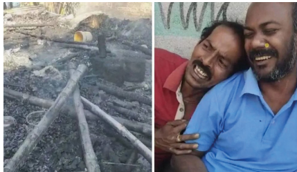
आग लगी और इसके बाद विस्फोट हो गया.

कल्याणी पुलिस स्टेशन और दमकल विभाग की गाड़ियां घटनास्थल पर मौजूद हैं। प्रारंभिक तौर पर पुलिस को संदेह है कि आतिशबाजी बनाने समय शॉर्ट सर्किट से