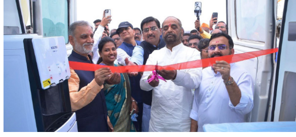
मोबाइल अस्पताल के उद्घाटन के अवसर पर बोल रहे थे।

6 फरवरी को भद्रावती तालुका के चंदनखेड़ा में भारतीय गैस प्राधिकरण के सामाजिक उत्तरदायित्व कोष के अंतर्गत एक निःशुल्क