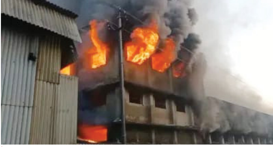
फैक्टरी का एक बड़ा हिस्सा जलकर खाक: उन्होंने बताया कि करीब 12 घंटे की कड़ी मशकत के