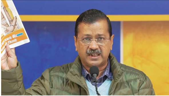
घोषणापत्र में अपने "असली इरादे" उजागर करने का आरोप लगाया और मतदाताओं को पार्टी का समर्थन नहीं करने को लेकर आगाह किया।

दिल्ली के पूर्व मुख्यमंत्री अरविंद केजरीवाल ने मंगलवार को भारतीय जनता पार्टी (भाजपा) के चुनावी घोषणापत्र को "देश के लिए खतरनाक" बताया। उन्होंने आरोप लगाया कि पार्टी सत्ता में आने पर सरकारी स्कूलों में मुफ्त शिक्षा बंद करने और मोहल्ला क्लीनिक सहित मुफ्त स्वास्थ्य सेवाओं को खत्म करने की योजना बना रही है। केजरीवाल ने प्रेस वार्ता में भाजपा पर