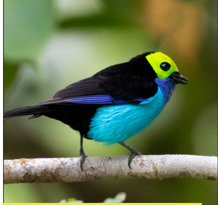
पैराडाइज टैनेजर पक्षी

○ स्वर्गपक्षी या बर्ड ऑफ पैराडाइज पासरीफोर्मीज गण के पैराडाइसियेडाए कुल के सदस्य हैं। इस जाति की अधिकांश जातियां न्यू गिनी के द्वीप और इसके समीपी क्षेत्रों में पाई जाती हैं। तथा कुछ प्रजातियां ऑस्ट्रेलिया और पूर्वी ऑस्ट्रेलिया में पाई जाती हैं। इस जाति की 13 श्रेणियों में 40 प्रजातियां हैं। अधिकांश प्रजातियों में नरों के पंखों के कारण इस जाति के सदस्य प्रसिद्ध हैं, ये पंख विशेष रूप से अत्यधिक लंबे होते हैं तथा चोंच, डैनों एवं सिर पर फैले हुए परों के रूप में होते हैं। इनकी अधिकांश संख्या घने वर्षावनों तक ही सीमित है। सभी प्रजातियों का प्रमुख आहार फल तथा कुछ हद तक कीड़े मकड़े हैं। बर्ड ऑफ पैराडाइज पक्षियों में प्रजनन की विभिन्न प्रणालियां हैं जो एक मादा से लेकर सामूहिक रूप से कई मादाओं पर आधारित होती है। न्यू गिनी के निवासियों के लिए इस जाति का सांस्कृतिक महत्व है। बर्ड ऑफ पैराडाइज की खालों तथा पंखों का व्यापार दो हजार साल पुराना है, तथा पश्चिमी संग्रहकर्ताओं, पक्षी वैज्ञानिकों एवं लेखकों की इन पक्षियों में काफी रूचि है। शिकार तथा निवास स्थलों की हानि के कारण कई प्रजातियां खतरे में हैं। बर्ड ऑफ पैराडाइज का शरीर आम तौर पर कौबे जैसा होता है तथा वास्तव में ये कॉंबिडेस प्रजाति (कौबे तथा नीलकंठ) से संबंधित हैं। बर्ड ऑफ पैराडाइज पक्षी विभिन्न आकारों में पाए जाते हैं जो किंग बर्ड ऑफ पैराडाइज 50 ग्राम (1.8 औंस) और 15 से.मी. (5.9 इंच) से ले कर कर्ल-क्रेस्टेड मनुकोड 44 से.मी. (17 इंच) व 430 ग्राम