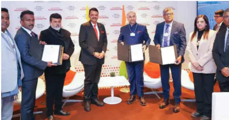
प्रमुख अमित कल्याणी ने मुख्यमंत्री देवेन्द्र फड़णवीस से मुलाकात कर यह अहम समझौता किया।

महाराष्ट्र राज्य सरकार और कल्याणी समूह में इस्पात और रक्षा क्षेत्र में एक समझौता हुआ है। गढ़चिरोली में स्टील उद्योग के लिए 5 हजार 200 करोड़ रुपये का निवेश किया जाएगा। इससे 4 हजार नौकरियां भी पैदा होंगी। दावोस में वर्ल्ड इकोनॉमिक फोरम में कल्याणी ग्रुप के