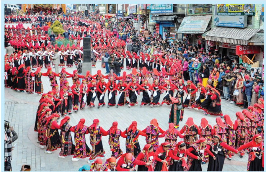
विंटर कार्निवल में मंगलवार को मनाली के मालरोड पर महिला मंडलों की महानाटी आकर्षण का केंद्र रही।

पेट्रो ने एक्स पर लिखा कि ईएलएन ने युद्ध का रास्ता चुना है तो उनको यह मिलेगा। उन्होंने ईएलएन अब मादक पदार्थों की तस्करी करने वाला समूह बन गया है। ईएलएन शांति और लोगों से पूरी तरह से अलग हो गया है। पेट्रो ने 2022 में ईएलएन के साथ शांति वार्ता शुरू की थी, लेकिन कई मुद्दों पर असहमति के चलते वार्ता रुक गई है। कैटुम्बो क्षेत्र कोकैन बनाने और तस्करी के लिए बंदनाम है। इस इलाके में प्रभाव रखने वाले दो सशस्त्र संगठन नेशनल लिबरेशन आर्मी और कोलंबिया मावर्सिस्ट रिवोल्यूशनरी आर्म्ड फोर्सिस्ट गुट के बीच यह हिंसा हो रही है। इन दोनों गुटों के बीच शांति की कोशिश की जा रही थी, लेकिन उसके नाकाम होने के बाद हिंसा भड़क गई। इस हिंसा की चपेट में कई आम नागरिक भी आ गए हैं। हिंसा के चलते स्थानीय लोग पलायन कर गए हैं और कई पड़ोसी राज्यों में रह रहे हैं तो कुछ लोग कोलंबिया की सीमा पार कर वेनेजुएला पहुंच गए हैं। कैटुम्बो क्षेत्र की सीमाएं वेनेजुएला से लगती हैं। शरणार्थियों के लिए नजदीकी शहरों में आश्रय स्थल बनाए गए हैं। ईएलएन नेता एंटोनियो गार्सिया ने कहा कि उनका संगठन नागरिकों को निशाना बनाने का इरादा नहीं रखता है, बल्कि वह पूर्व विद्रोही लड़ाकों को निशाना बना रहा है जो अब एफएआरसी-ईएमसी के साथ सहयोग कर रहे हैं। कोलंबिया में हो रही हिंसा पर संयुक्त राष्ट्र ने भी चिंता जताई है।