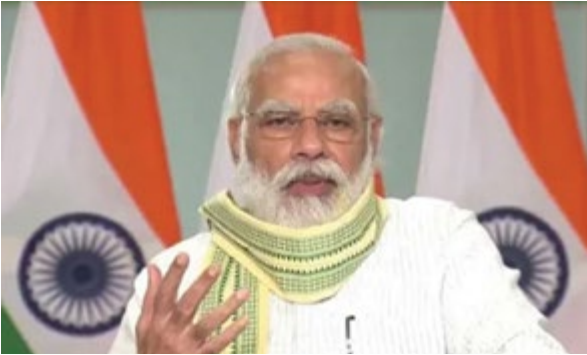
गांव शामिल हैं और साउथ दिल्ली के 16 से अधिक गांव शामिल हैं.

प्रधानमंत्री स्वामित्व योजना के तहत अब तक 3.17 लाख से