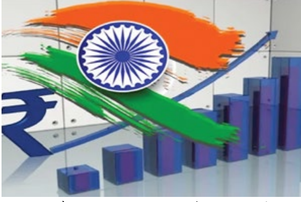
वापस आ रही है।

आईएमएफ की प्रबंध निदेशक क्रिस्टालिना जॉर्जीवा के अनुसार वर्ष 2025 में भी वैश्विक स्तर पर कीमतों में नरमी जारी रहेगी। उन्होंने कहा कि महंगाई से लड़ने के लिए जरूरी ऊंची ब्याज दरों ने वैश्विक अर्थव्यवस्था को मंदी में नहीं धकेला। जॉर्जीवा के अनुसार यह राहत की बात है और इससे कीमतों में नरमी देखी है। ऊंची ब्याज दरों ने वांछित परिणाम दिए हैं। उभरते बाजारों की तुलना में उन्नत अर्थव्यवस्थाओं में हेडलाइन मुद्रास्फूर्ति जल्दी ही लक्ष्य के भीतर