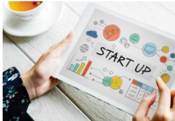
उद्योग संवर्धन एवं आंतरिक व्यापार विभाग (डीपीआईआईटी) के मुताबिक, समर्पित स्टार्टअप नीतियों वाले राज्यों/केंद्र शासित प्रदेशों में स्टार्टअप की संख्या 2016 के चार से बढ़कर 31 हो गई है। यूनिर्कॉन की भी संख्या कई गुना बढ़ी है।

देश के स्टार्टअप में नौ साल में फंडिंग 14 गुना से ज्यादा बढ़कर 115 अरब डॉलर पर पहुंच गई है। 2016 में यह सिर्फ 8 अरब डॉलर थी। इस अवधि में स्टार्टअप इंडिया पहल के लॉन्च के बाद से 2024 के अंत तक पंजीकृत स्टार्टअप की संख्या 400 से बढ़कर 1.57 लाख से अधिक हो गई है।