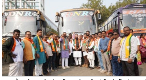
युवा और वरिष्ठ कार्यकर्ता शामिल हुए हैं. अनुशासित संगठन, देशभक्ति और एकता की भावना से प्रेरित होकर

प्रति प्रतिबद्धता और दृढ़ संकल्प के साथ इस यात्रा पर निकले हैं। इस यात्रा में बड़ी संख्या में महिला, पुरुष,