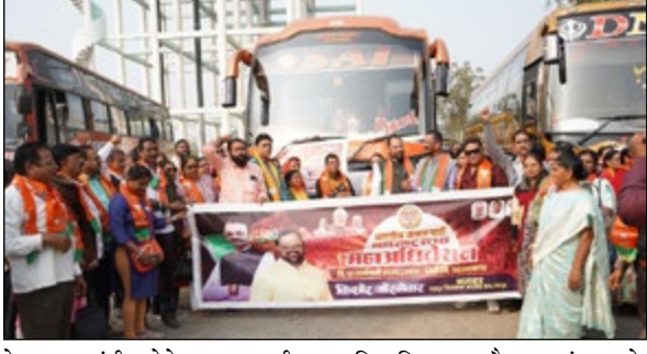
के मुख्यमंत्री देवेंद्र फडणवीस प्रमुख रूप से मौजूद रहेंगे। चंद्रपुर के कार्यकर्ता बड़ी ऊर्जा, राष्ट्रीय सेवा के