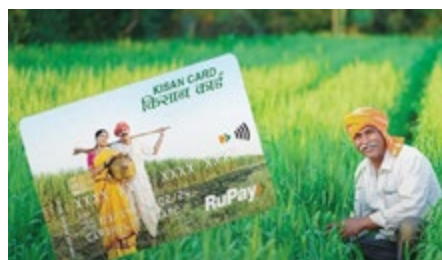
जुड़े कामों को करते हैं उन्हें 9 फीसदी के ब्याज पर शॉर्ट टर्म लोन प्रोवाइड कराया जाता है। इस स्कीम की खास बात यह है कि सरकार की ओर से लोन पर लगने वाले ब्याज पर 2 फीसदी की छूट भी देती है। वहीं जो किसान समय पर पूरे लोन का भुगतान कर देते हैं उन्हें प्रोत्साहन के तौर पर और 3 फीसदी की छूट दी जाती है। इसका मतलब है कि किसानों को ये लोन सिर्फ 4 फीसदी सालाना ब्याज पर दिया जाता है। 30 जून 2023 तक इस तरह के लोन लेने वालों की संख्या 7.4 करोड़ से ज्यादा

बजट 2025 में किसानों के लिए बड़ी राहत की खबर सामने आ सकती है। सरकार 1 फरवरी के आगामी बजट में किसान क्रेडिट कार्ड की लिमिट 3 लाख रुपए से बढ़ाकर 5 लाख रुपए करने की तैयारी कर रही है। मामले से परिचित एक सूत्र ने बिजनेस स्टैंडर्ड की रिपोर्ट में कहा कि केसीसी लिमिट में आखिरी बार बदलाव काफी समय पहले हुआ था, और सरकार को लगातार मांगें मिल रही थीं, इस कदम का उद्देश्य किसानों को सपोर्ट करना और प्रामाण्य मांग को बढ़ावा देना है। इसलिए, सरकार केसीसी की लिमिट को बढ़ाकर 5 लाख रुपए कर सकती है। किसान क्रेडिट कार्ड स्कीम को अब से करीब 26 वर्ष पहले साल 1998 में शुरू किया गया था। इस स्कीम के तहत जो किसान खेती और उससे