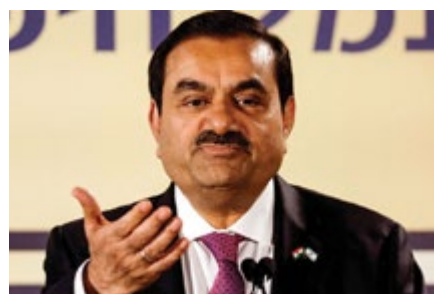
बंद हुए, अदानी एंटरप्राइजेज का शेयर

अदानी विलमर के शेयर में शुक्रवार को 10 प्रतिशत की गिरावट आई। समूह के अदानी विलमर की 20 प्रतिशत हिस्सेदारी बेच 7,148 करोड़ रुपये जुटाने की घोषणा के बाद इसके शेयर टूटे, बीएसई में शेयर 9.99 प्रतिशत की गिरावट के साथ 291.60 रुपये पर आ गया, जो इसकी निचली सीमा है। एनएसई में भी यह 10 प्रतिशत फिसलकर 291.10 रुपये की निचली सीमा पर पहुंच गया। इस बीच, बीएसई पर सूचीबद्ध अदानी समूह की सभी 10 कंपनियों के शेयर नुकसान के साथ