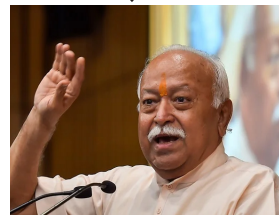
कमी के कारण हुए। कार्यक्रम को संबोधित करते हुए उन्होंने कहा कि धर्म का सही

मोहन भागवत ने धर्म की सही शिक्षा और इसके महत्व को रेखांकित किया। उन्होंने कहा कि धर्म का अपूर्ण और अनुचित ज्ञान अधर्म को जन्म देता है, इतिहास गवाह है कि धर्म के नाम पर जो भी अत्याचार हुए, वे वास्तव में धर्म की गलत समझ और इसकी अपर्याप्त जानकारी के कारण हुए। उन्होंने कहा कि धर्म का सही और समग्र ज्ञान ही मानवता के कल्याण का मार्ग प्रशस्त करता है। मोहन भागवत ने इस बात पर जोर दिया कि धर्म के सिद्धांतों को सही तरीके से समझाया और सिखाया जाना चाहिए। उन्होंने कहा कि धर्म की अंधी समझ मानवता के लिए घातक है, धर्म का उद्देश्य मानव कल्याण है।