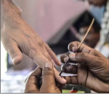
जरीफ संविधान में 129वां संशोधन और दिल्ली व जम्मू-कश्मीर के केंद्रशासित प्रदेश के कानून में बदलाव किया जाएगा. सरकार इससे जुड़े