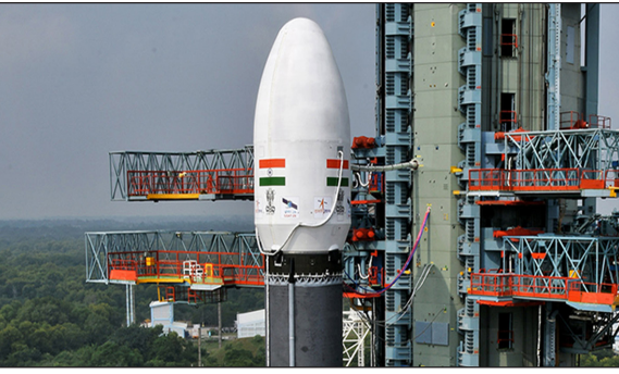
जाना जा सके। इसरो ने एक्स पर पोस्ट के सपने आकार ले रहे हैं। गगनयान मिशन के लिए मील का पत्थर! पहले

गगनयान मिशन की तैयारी कर रहे इसरो ने एक और उपलब्धि हासिल की है। भारतीय अंतरिक्ष एजेंसी ने शुक्रवार को घोषणा की कि पहले मोटर सेगमेंट को प्रक्षेपण परिसर में पहुंचाया गया है। इससे पहले इसरो ने अंतरिक्षयात्रियों को समुद्र के रास्ते सुरक्षित वापस लाने के लिए नौसेना के साथ मिलकर छह दिवसों को 'वेल डेक' रिकवरी परीक्षण किया था। 'वेल डेक' ऐसे जहाज को कहते हैं जिसमें पानी भरा जा सकता है ताकि नावों, अंतरिक्षयान को जहाज के भीतर ले