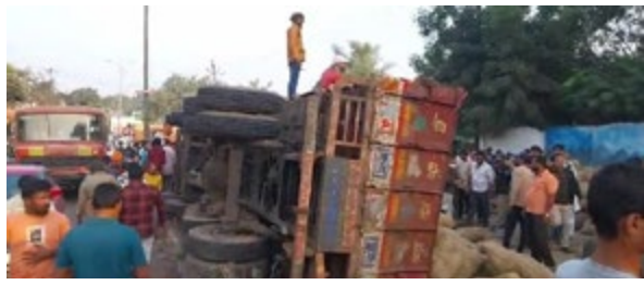
पेपर मिल कांटा गेट के पास अनियंत्रित ट्रक हुआ पलटी, चालक गंभीर

बल्लारपुर. तेलंगाना राज्य से आलू भरकर आने वाले अनियंत्रित ट्रक क्रमांक एपी 16 टीएच 1444 का नियंत्रण खोने से बाइक सवार को बचाने के चलते ट्रक पलटी हुआ है, जिससे ट्रक चालक को गंभीर चोट लगी है, यह घटना आज शाम करीब पांच बजे पेपर मिल कांटा गेट के पास हुई है, घटना की जानकारी मिलते