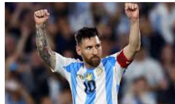
आयोजन के लिए सभी वित्तीय सहायता राज्य के व्यापारियों द्वारा प्रदान की जाएगी। उन्होंने कहा, 'दिग्गज खिलाड़ी लियोनेल मेस्सी सहित अर्जेन्टीना